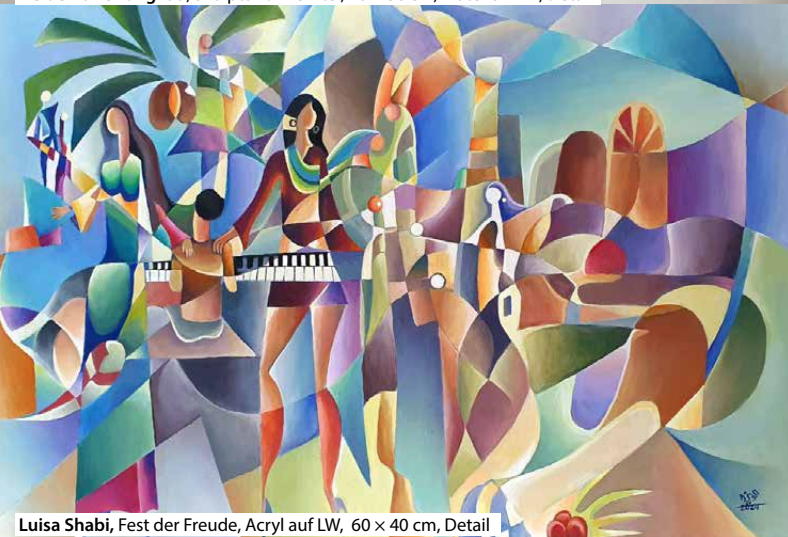
Luisa Shabi, Fest der Freude, Acryl auf LW, 60 x 40 cm, Detail