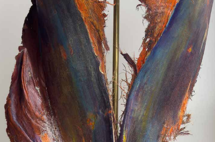
Heidemarie Langkau, Skulptur ohne Titel, 70 x 30 cm, Material-Mix, Detail