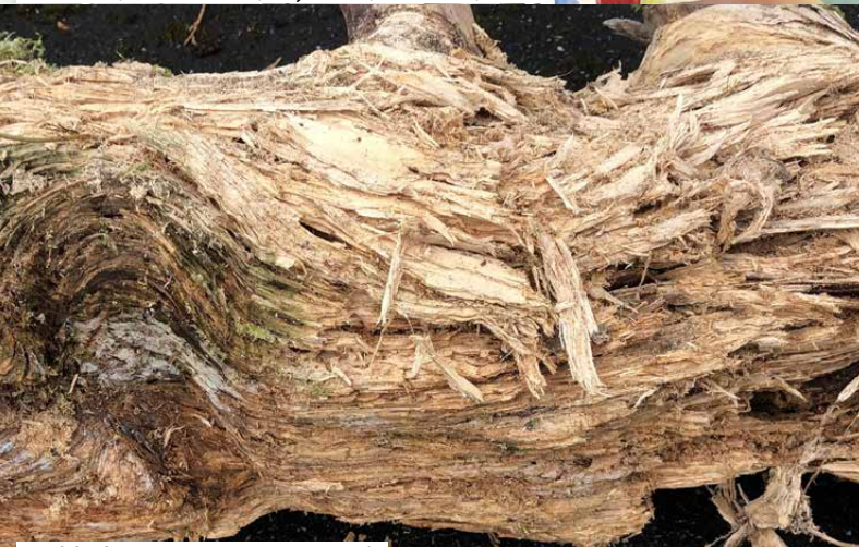
Azad Ibrahim, 2020_09_24_12_08, Detail

Eröffnung: Sonntag, 8.12.2024 um 11.00 Uhr Wir laden Sie herzlich ein.