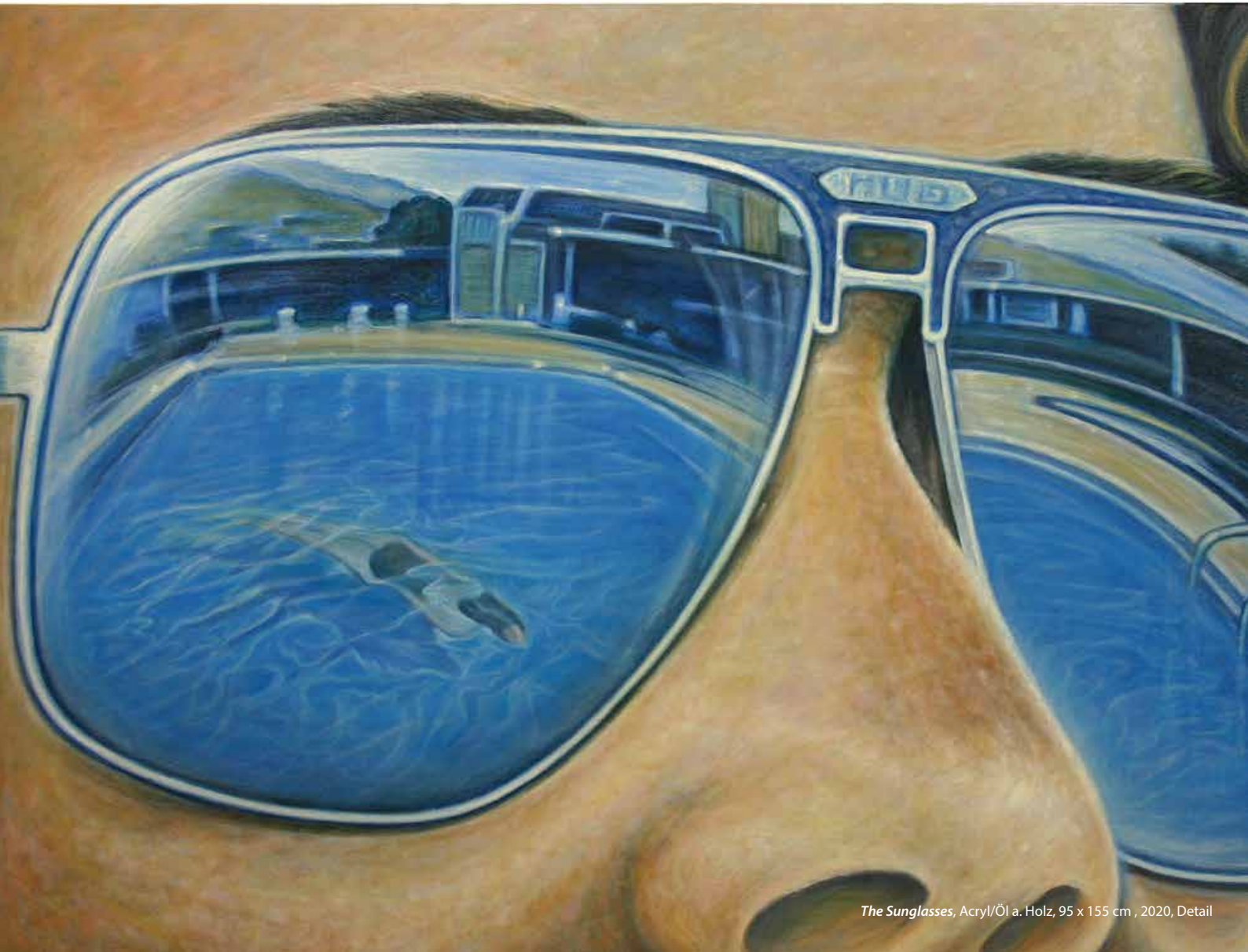
The Sunglasses , Acryl/Öl a. Holz, 95 x 155 cm , 2020, Detail